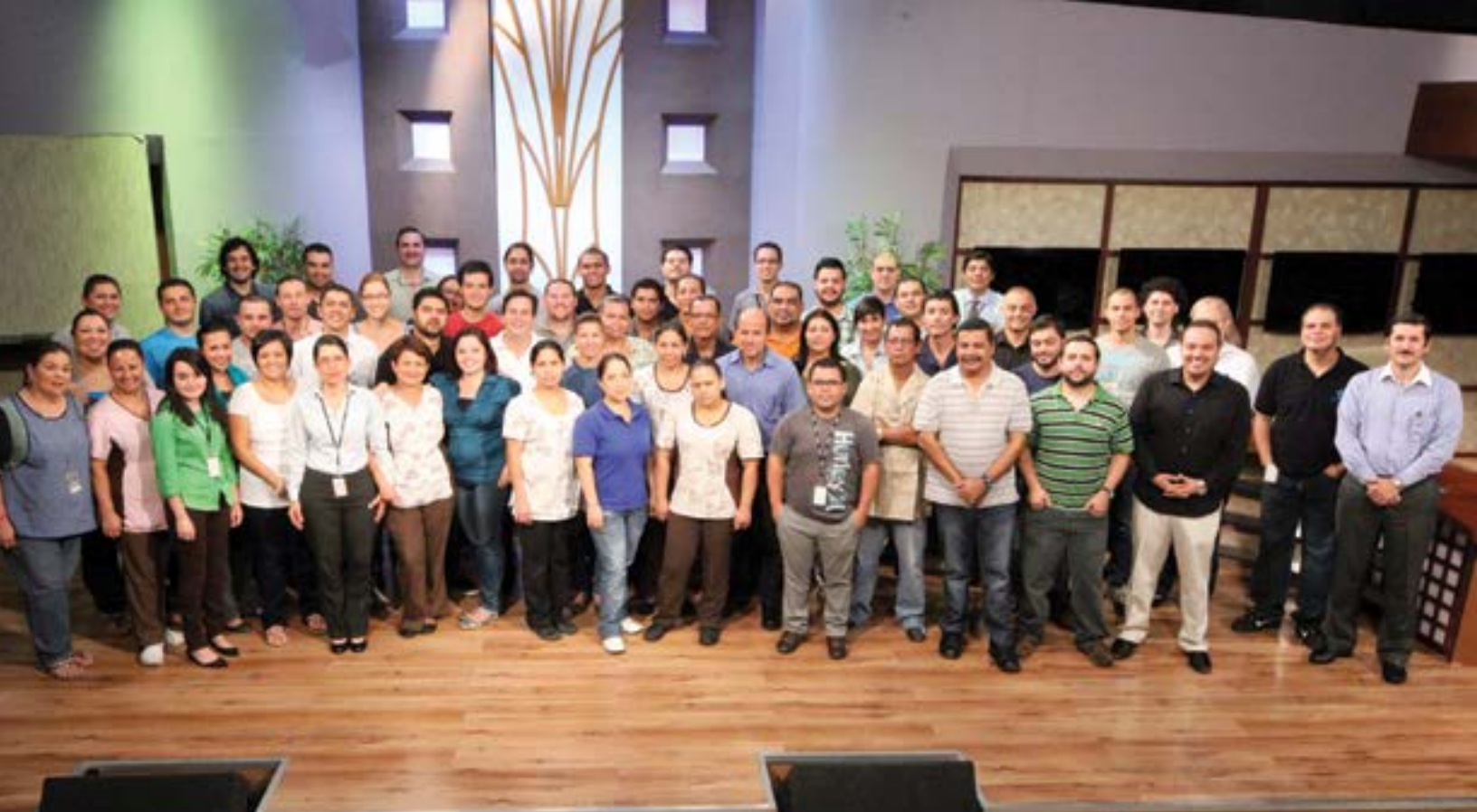
Los compañeros de visión de Enlace Costa Rica.