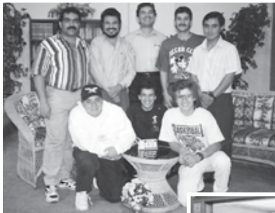
Algunos compañeros de visión del Canal 23 en el primer estudio de las instalaciones actuales en Pavas, Costa Rica en 1995.