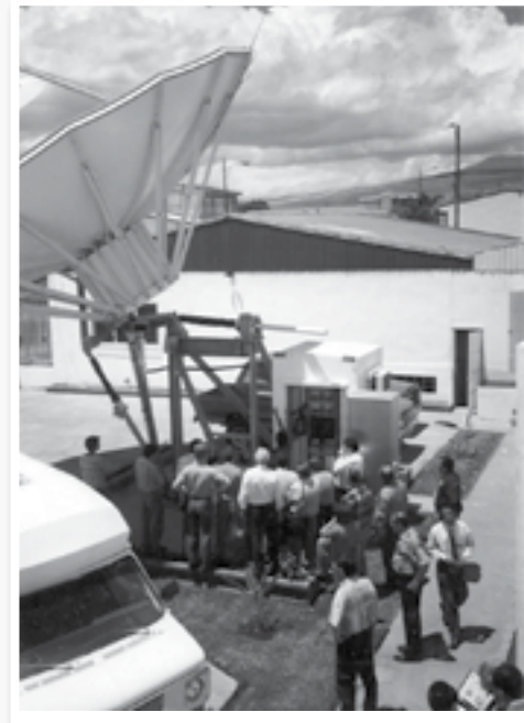
Inauguración del primer satélite Solidaridad II que llevó la señal de Enlace desde San José, Costa Rica con cobertura desde el sur de los EEUU hasta Colombia y Venezuela.