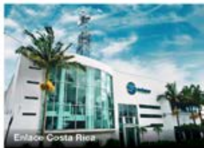
Enlace Costa Rica