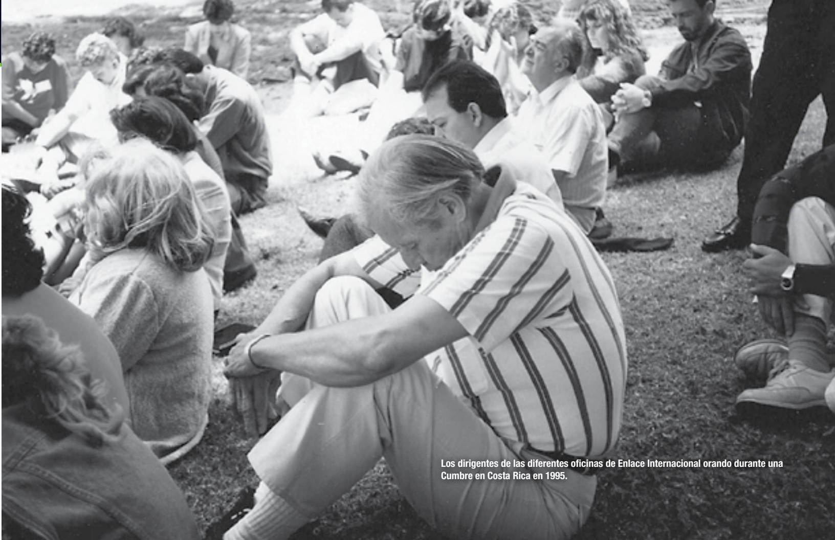
Los dirigentes de las diferentes oficinas de Enlace Internacional orando durante una Cumbre en Costa Rica en 1995.