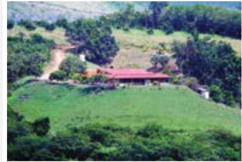
El Campamento Valle Alegre, de 10 hectáreas, fue donado a la Fundación Esperanza de Venezuela el 15 de diciembre del 2012.