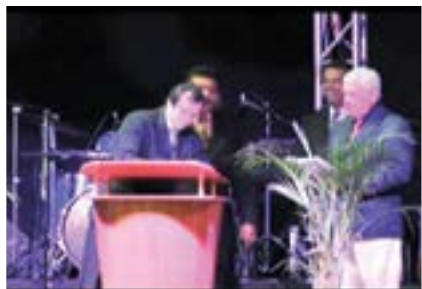
En Enlace practicamos lo que predicamos. Sobre estas líneas la firma de la donación de las 25 hectáreas del Campamento Valle Bendecido al Concilio de las Asambleas de Dios de Venezuela el 25 de enero del 2012.