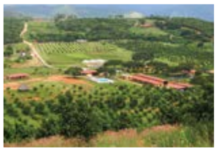
Las instalaciones de Valle Bendecido.

Dios estableció una ley que afecta todas las áreas de la vida. Hay una constante segura en todo lo que hacemos: lo que sembramos lo cosecharemos. Dios dijo: “mientras esté la tierra habrá día y noche, estaciones, así también hará siembra y cosecha”. Como modelo de vida en Enlace nos hemos propuesto sembrar buenas semillas, sabiendo que cosecharemos buenos frutos y procuramos hacerlo en cada campo de la vida, reconociendo que Dios propiciará cosechas abundantes que rebosan en bendición multiplicada de forma sobrenatural.