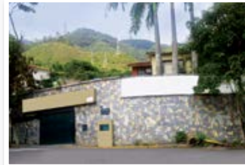
El 9 de febrero del 2012 también donamos la quinta San Bernadino a la Fundación Hogares Bambi, que alberga a niños huérfanos y en riesgo social en Venezuela.