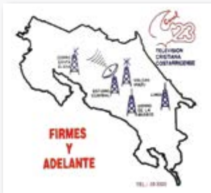
El primer logo de Canal 23 en Costa Rica puede ser visto en esta calcomanía que se regaló a los ofrendantes.